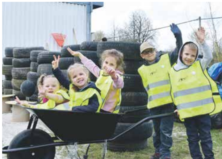
Do jarní akce Uklidme Česko se zapojují lidé po celé republice už od roku 2014.

V neděli 29. března se k iniciativě připojí sousedé z Javorovky. Od 9.30 do 13.00 hodin zbaví odpadků pozemky v okolí bytových domů. Účastníci se sejdou na dětském hřišti mezi Mantovskou