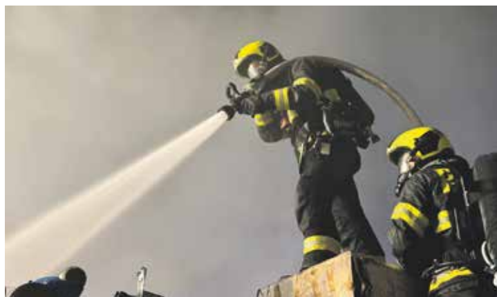
Požár šrotu v ulici Ke Kablu si vyžádal vyhlášení třetího stupně poplachu.

Podle Řezáče se jednotky následně zredukovaly a stupeň poplachu klesl. „Stále pak probíhaly