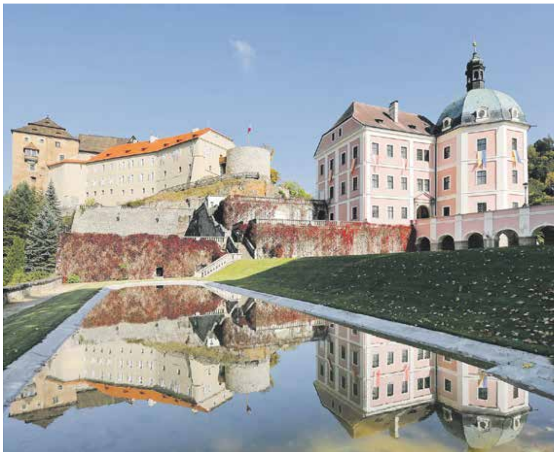
Letošním velkým lákadlem bude zpřístupnění středověkého hradu Bečov nad Teplou.

Česká republika je protkaná sítí značených turistických pěších cest, jejichž délka přesahuje 43 tisíc kilometrů, a dalších tisíce kilometrů mají značené cyklostezky. Česko a jeho obyvatelé se řadí k největším milovníkům pěších pochodů a objevování krás své země. Stovky hradů a zámků po celé zemi přinášejí možnosti, jak poznávat historii nejen svého regionu. Památky se nyní otevírají návštěvníkům a turistická sezona začíná letos v první dubnový víkend.